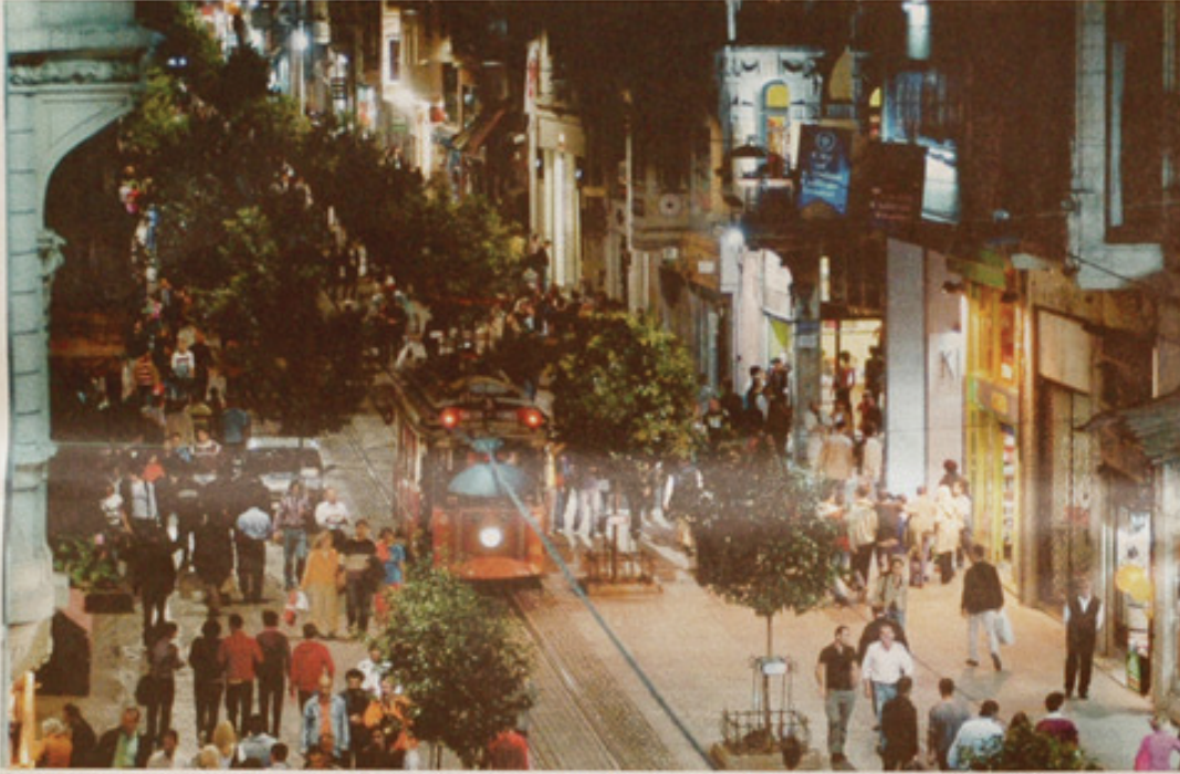
Timurtaş Onan, "Beyoğlu'nda Gece"yi ortaya çıkarmak için 6 ay boyunca akşam 22.00'den sabah 04.00'e kadar yarıda fotoğraf makinesi ve bir ses kayıt cihazıyla Beyoğlu sokaklarını adım adım dolaştı. Görüşlerini çekti, duygularını kaydetti.

Gönlünü fotoğraf sanatına ve Beyoğlu'na kaptıran Timurtaş Onan, 6 ay boyunca Beyoğlu'nun görünen ve görünmeyen sokaklarında sabaha kadar dolaşıp birbirinden ilginç 250 fotoğraf çekti. Aynı zamanda bir ses kayıt cihazıyla bu fotoğrafları Beyoğlu'nun doğal sesleriyle zenginleştirdi. Ortaya çıkan bu çarpıcı estelasyon Almanya'da da gösteriliyor